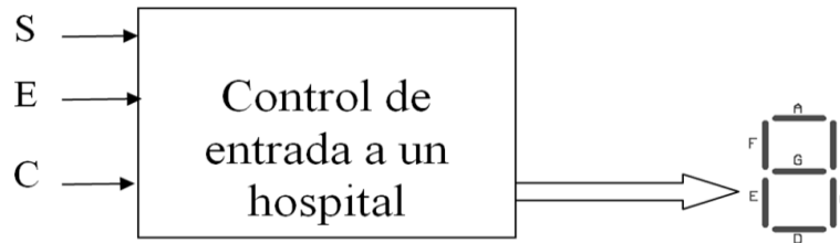
DIAGRAMA DE BLOQUES:

La asignación de variables a cada uno de los siete segmentos del display y la tabla de verdad utilizando lógica negada correspondiente a este sistema se observa en la siguiente tabla de verdad. El manejo de la tabla de verdad se asocia a un vector de entrada de tres bits A [2:0] en el cual se asigna al paciente de una súper-emergencia el valor A2, al paciente con una emergencia el valor A1 y al paciente que llegue tan solo a chequeo el valor A0.